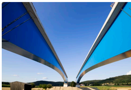
Ingenieurpreis 2019, 1. Platz: Intelligente Segmentbrücke über die B299, Firmengruppe Max Bögl

Der Ingenieurpreis zeichnet auch effiziente, kreative, interdisziplinäre, digitale Planungs- und Arbeitsmethoden aus. Dabei kommt dem konstruktiven Austausch und der teamorientierten Zusammenarbeit aller am Bau Beteiligten über die einzelnen Fachdisziplinen hinweg eine besondere Bedeutung zu.