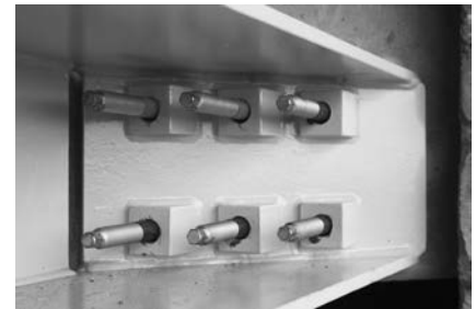
Das Bild zeigt die Verbundankerschrauben

Bei der Wasserentnahme wurden auch die Umweltbedingungen