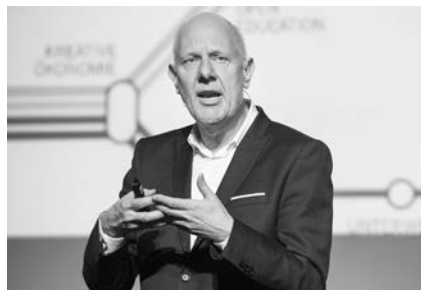
Hauptredner Matthias Horx lud zum Blick in die Zukunft ein.

Mit den 900 anwesenden Gästen macht er die Probe aufs Exempel und stellte ihnen Fragen aus dem „global ignorance test“. So schätzte nahezu niemand richtig, dass die weltweite,