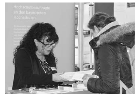
Beratungsgespräch auf der IKOM.

Von besonderem Interesse waren wie in den Jahren zuvor Informationen rund um Bauberechtigungen und Listeneintragen. Aber auch der kostenfreie Eintrag in die Studierendenliste der Kammer stieß auf reges Interesse bei den Nachwuchsingenieuren. pol