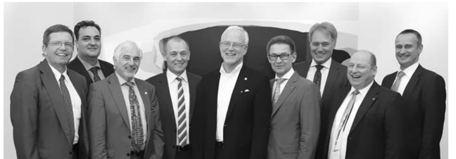
Der am 24. November 2016 neu gewählte Vorstand.

Welche Gremien in welcher Besetzung berufen wurden, können Sie auf der Kammerhomepage nachlesen.