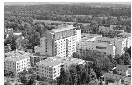
Das RoMed Klinikum in Rosenheim.

gleichzeitig die Funktion von Treppen und Rampen. Außerdem wurden bei der Montage auch die Kranpositionen an die gegebenen Umweltbedingungen angepasst.