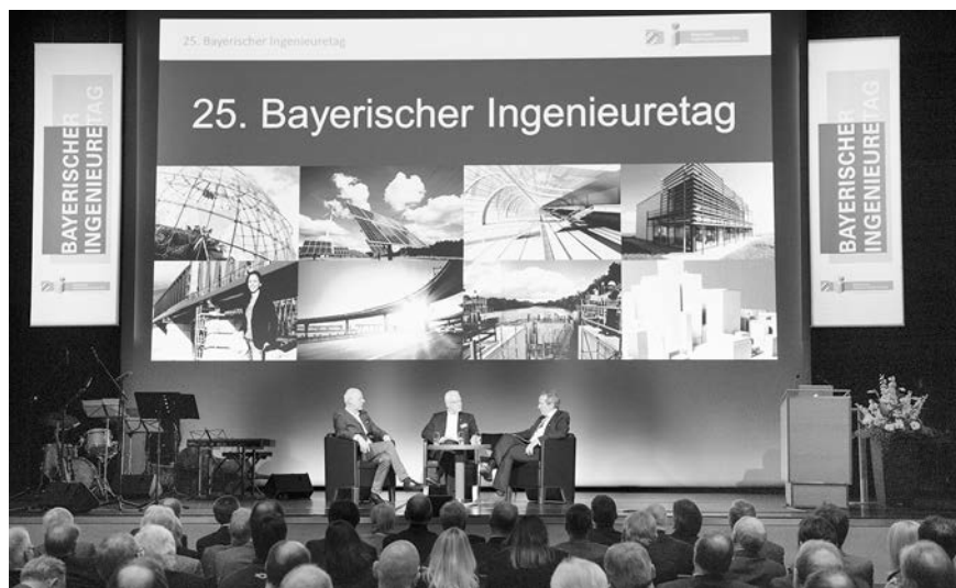
Die Gesprächsrunde beim 25. Bayerischen Ingenieuretag.

durchschnittliche Lebenserwartung bei stolzen 70 Jahren liegt.