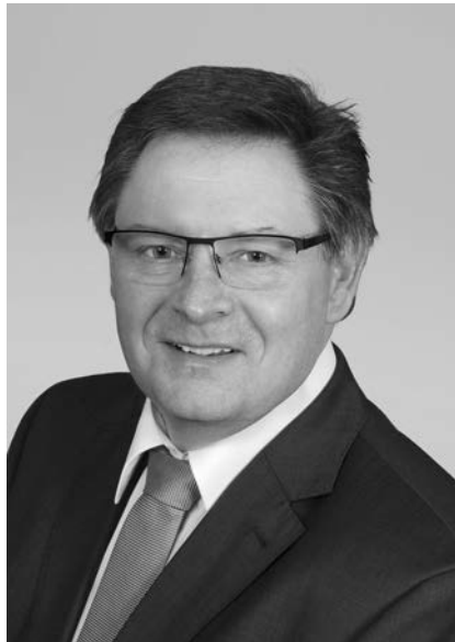
Der Vorstand traf sich mit Staatssekretär Eck zum Gespräch.

Zentrale Punkte des Gesprächs im Dezember waren der Erhalt der Planungskapazitäten für Verkehrswege in Bayern und die Notwendigkeit, eine Verpflichtung zur Prüfung von Energienachweisen zu regeln, beispielsweise durch Prüfsachverständige für baulichen Wärmeschutz. Außerdem informierte der Kammervorstand die Abgeordneten über die Novellierung der Energieeinsparverordnung.