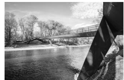
Platz 2 für den Isarsteg Nord in Freising.

sich das Konzept für alle Straßen- und Eisenbahnbrücken eignet und keine besonderen Eingriffe in den Verkehr auf den Brücken erfordert.