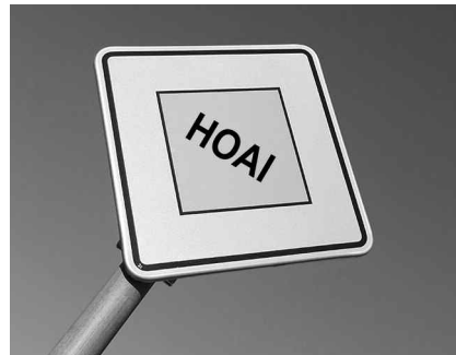
2019 entscheidet der EuGH über die HOAI.

Die Bundesregierung argumentiert, die HOAI diene der Qualitätssicherung, da durch die verbindliche Vorgabe einer Honorarspanne Preisdumping vermie-