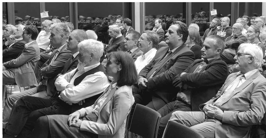
Der Ingenieurberuf hat Zukunft - und noch viel Potenzial, fanden die Teilnehmer der Tagung in Tutzing.