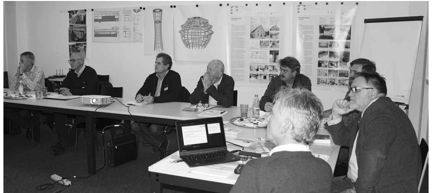
Vorlagen für den Standardschriftverkehr erleichtern die Arbeit.

Seit 2017 stehen insgesamt 16 Vertragsvorlagen als bearbeitbare Word-Dateien und auch als PDF kostenlos zum Download auf der Kammerhomepage bereit. Die Vorlagen für den Standard-Schriftverkehr beinhalten unter anderem Muster für den Abschluss der Leistungsphase 4, die Anforderung eines Terminplanes durch den Auftraggeber sowie Bedenkenanmeldungen.