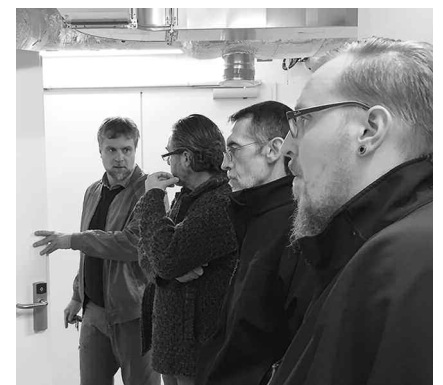
Die Technik nimmt in der Klinik viel Raum ein.

Was an Fläche für die Operationssäle und Sterilisationsräume vorhanden ist, musste in fast gleichem Umfang für die Technikeinrichtungen vorgesehen werden. amt