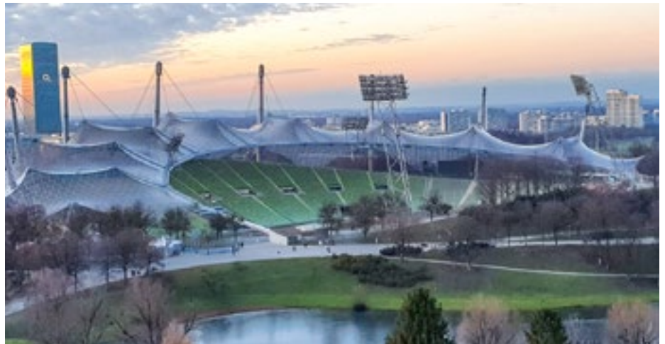
Das Dach des Münchner Olympiastadions ist in der ganzen Welt bekannt.

Die Schülerinnen und Schüler, die beim Wettbewerb mitmachen möchten, müssen von ihrer betreuenden Lehrkraft oder einem Elternteil bis spätestens 30. November 2020 auf der Onlineplattform www.junioring.ingenieure.de registriert werden. Bis Februar 2021 müssen dann die fertigen Modelle gebaut und abgege-