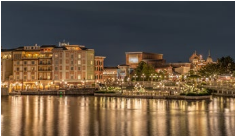
Gute Beleuchtung setzt die Städte bei Nacht in Szene.

Das diesjährige Konferenzthema "Stadt und Licht" wird unter sowohl unter technischen wie umweltpolitischen Aspekten beleuchtet. Aus den Reihen der Bayeri-