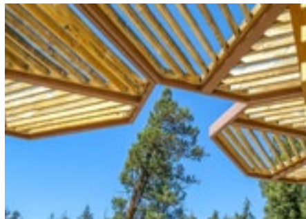
Modern Bauen mit Holz.

Welche technischen Möglichkeiten und Grenzen der Holzbau bietet und wieviel fachplanerisches und verwaltungsrechtliches Knowhow notwendig ist, darüber spricht nun am 28. Oktober ein hochkarätiges Referententeam in Fürstenfeldbruck. Die Regierungen von Oberbayern und Niederbayern sowie proHolz Bayern sind Partner der Veranstaltung.