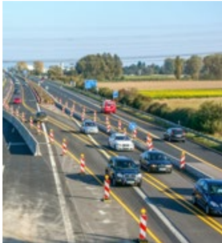
Schnelleres Bauen ist im Interesse aller.

Im Bereich der Verwaltungsgerichtsbarkeit soll die Eingangszuständigkeit für Streitigkeiten, die bestimmte Infrastrukturvorhaben zum Gegenstand haben,